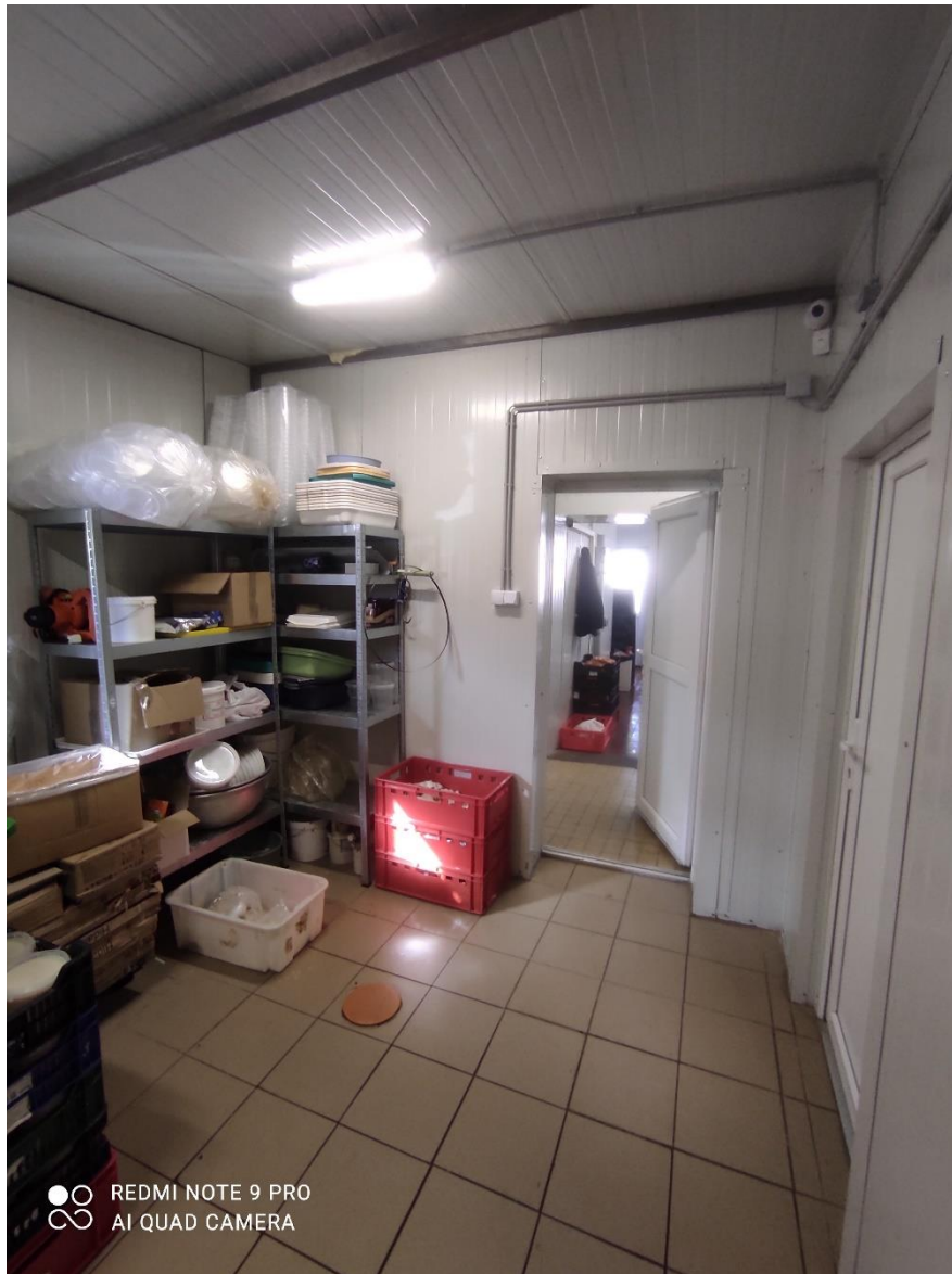
Eszközök/gépek beszerzése fényképek: